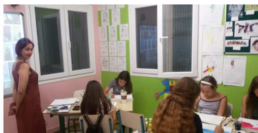
Summer Arts Camp

Μαθητές ... εν δράσει & αγγλικά στην πράξη!