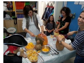
Halloween - Σκάλισμα κολοκύθας

κατασκευές. Οι μεγαλύτεροι μαθητές γιόρτασαν μέσα από μοναδικά εργαστήρια και δραστηριότητες που είχαν οργανώσει οι καθηγητές. Thriller dance, Fortune telling, Pumpkin Carving, Face Painting, Mummies wrap, Apple Bobbing ήταν μόνο μερικές από τις δραστηριότητες που συμμετείχαν οι μαθητές!