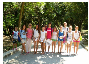
Σχεδιάζουμε προγράμματα για κάθε ηλικία και στόχο

Στους δύσκολους καιρούς που ζούμε κατανοούμε τις ανησυχίες της κοινωνίας μας και στηρίζουμε την οικογένεια που μας τιμά και μας εμπιστεύεται την εκπαίδευση των παιδιών της.