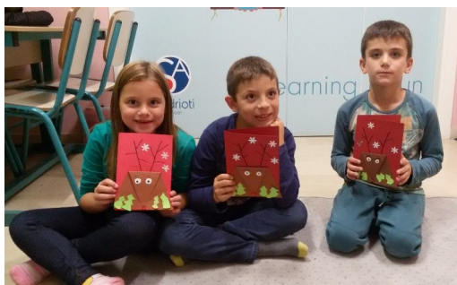
Play'n'Learn—ευχές στους φίλους μας στην Ιαπωνία

Η ζωή του σχολείου μας εμπλουτίζεται κάθε χρόνο με εκδηλώσεις & δραστηριότητες για μαθητές και γονείς