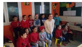
Wear Red Day—σύνδεση με Κύπρο