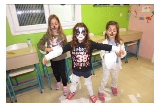
Halloween - παιχνίδια της ημέρας