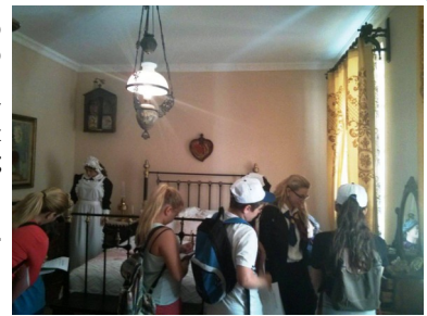
Οι μαθητές μας στο Casa Parlante

Φιλοσοφία μας είναι η βιωματική εκπαίδευση , και ενθαρρύνουμε τους μαθητές να συμμετέχουν σε προγράμματα που ασκούν την αγγλική γλώσσα εκτός πλαισίου βιβλίων.