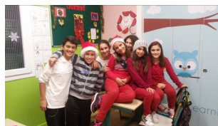
στο Wear Red Day.

Λίγο πριν της διακοπές των Χριστουγέννων το σχολείο μας, μαζί με αριθμό σχολείων στην Ελλάδα και την Κύπρο διοργανώνουν το Wear Red Day. Μαθητές, καθηγητές και γονείς φορούν κόκκινα, βοηθούν μία φιλανθρωπική οργάνωση αλλά και συνδέονται μέσω skype με σχολεία που συμμετέχουν