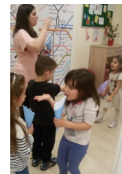
Easter Egg Hunt

Όλοι οι μαθητές του σχολείου έκαναν σχετικές δραστηριότητες στα αγγλικά!