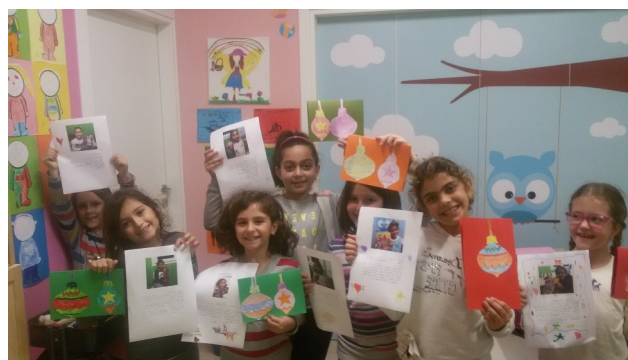
Kids A—γράμματα στους φίλους μας στην Αμερική